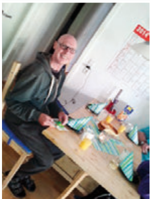
Geburtstage und Feiern