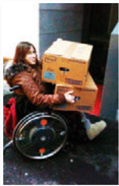
Erledigungen in der Stadt

Es gibt keine spezielle medizinische Betreuung. Die Bewohner suchen sich selbst oder mit Hilfe, eigene Haus- und Fachärzte. Zu Terminen können sie, wenn es erwünscht oder notwendig ist von unserem Personal begleitet werden. Wir können beim Richten von Medikamenten und bei der Kontrolle, ob Medikamente genommen wurden, unterstützen. Jede Medikamenteneinnahme kann jedoch nicht durch uns überwacht werden.