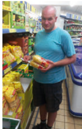
Anleitung/Unterstützung bei Einkäufen

Wenn möglich im Haus. Im Regelfall sollten die Bewohner auch im Krankheitsfall, außerhalb der geplanten Betreuungszeiten alleine zu Recht kommen. In Notfällen oder bei besonders schweren Erkrankungen ist über die Wohnanlage Kilianshof 24h am Tag jemand erreichbar. Von dort aus würde dann, wenn notwendig, das Personal des Wohntrainings/AUW kontaktiert werden und nach dem Patienten sehen.