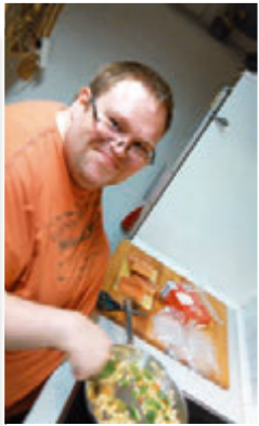
Gesunde Ernährung/ Kochtraining