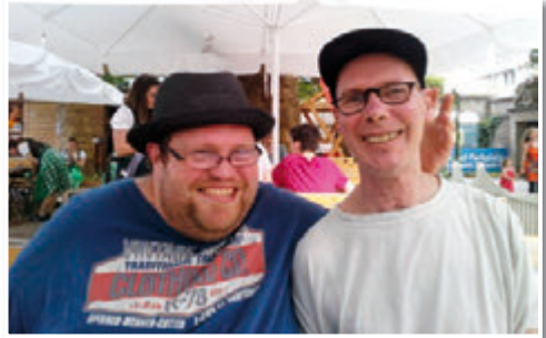
Ausflüge machen Spaß