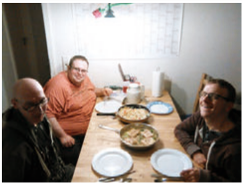
Gemeinsame Mahlzeit in einer WG

In Notfällen kann die Nachtwache der Wohnanlage Kilianshof kontaktiert werden und weitere Schritte einleiten. Die Nachtwache kann